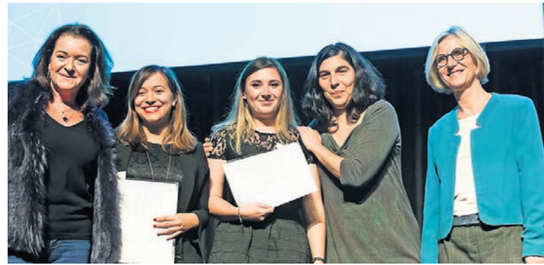
Cérémonie de remise des diplômes de la Haute école de travail social le 21 novembre 2019 au Cube.