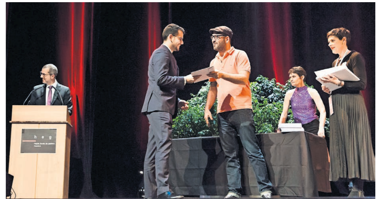
Cérémonie de remise des diplômes de la HEG, le 26 novembre 2019 au Théâtre du Léman.