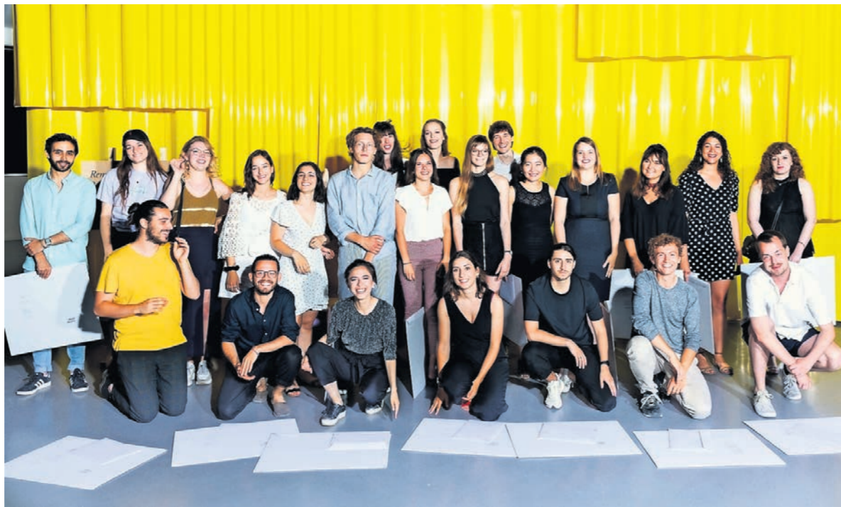
Les diplômées et diplômés en Communication visuelle, option espace/media, de la HEAD, le 27 juin 2019.