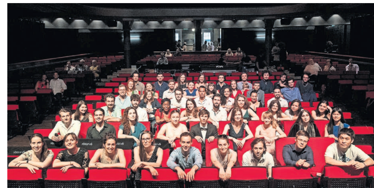
Des diplômées et diplômés de la Haute école de musique de Genève lors de la remise des prix, le 25 juin 2019. CAROLE PARODI