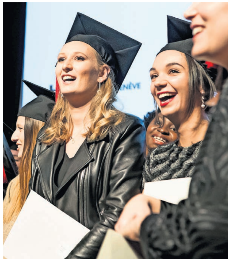
Cérémonie de remise des diplômes de la Haute école de santé, au Cube, sur le campus de la HEAD, le 19 novembre 2019.