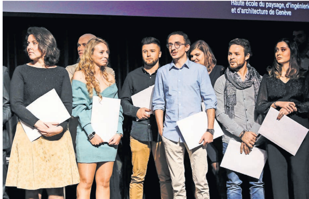
Célébration des diplômées et diplômés de l'HEPIA, le 20 novembre 2019.